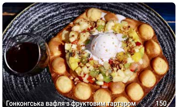
Гонконгська вафля з фруктовим тартаром