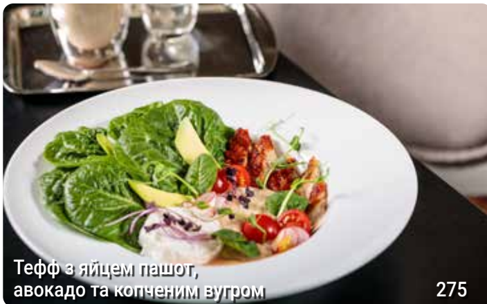
Тефф з яйцем пашот, авокадо та копченим вугром

Sausages with ucheletto beans, scrambled eggs, grilled tomatoes and crunchy croutons