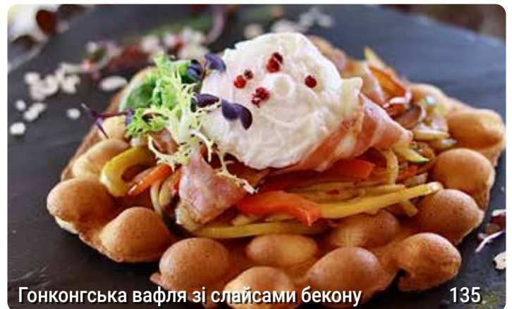
Гонконгська вафля зі слайсами бекону