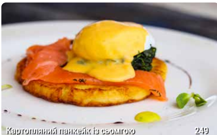
Картопляний панкейк із сьомгою