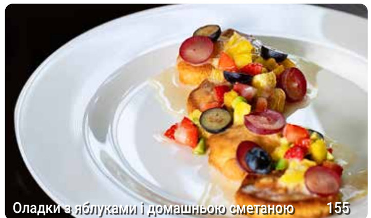
Оладки з яблуками і домашньою сметаною